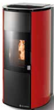
ARIANNA METALLO ROSSO