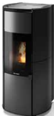
ARIANNA CERAMICA NERO LUCIDO

Design esclusivo, elevate prestazioni e massimo comfort identificano il nuovo prodotto di casa CS Thermos. Le emissioni sono ridotte al minimo e l'innovazione è al servizio del benessere umano e dell'ambiente.