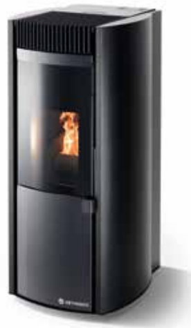
GARDA METALLO NERO

Exclusief design, hoge prestaties en maximaal comfort kenmerken dit nieuwe product van CS Thermos. Lage emissies en innovatieve voorzieningen komen zowel het gebruikscomfort als het milieu ten goede.