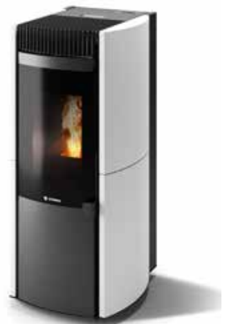
GARDA PLUS CERAMICA BIANCA